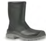
SIBERIAN - S. 37