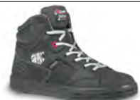
RIDE - S. 10