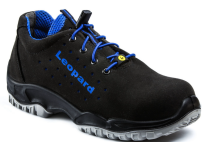
COOL PLUS - S. 35