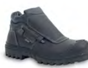
SOLDER - S. 25 & 30