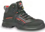
STRONG II - S. 19