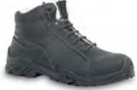
AVALANCHE - S. 21 & 36