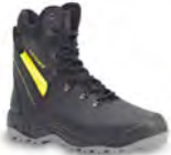
ALASKA - S. 24 & 36