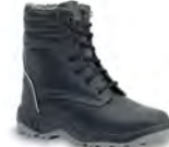
SNOW - S. 37