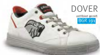
DOVER zertifiziert gemäß BGR 191

..... keine Lagerware, kurzfristig lieferbar