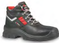
GRAVEL - S. 25