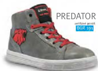
PREDATOR zertifiziert gemäß BGR 191