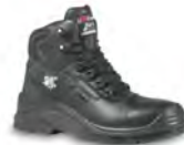
DROP - S. 22