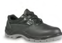
POLIER - S. 27