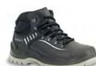
MARS - S. 17 & 23