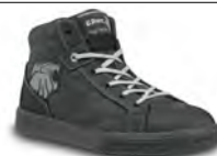
LION - S. 11