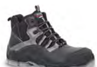
MOGLI - S. 18