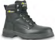
BOB - S. 22