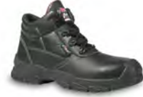
FORTIS II - S. 19 & 27