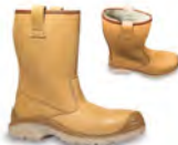
JALASKA - S. 22 & 36