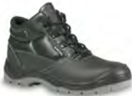
COMFORT-ÜK - S. 27