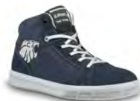
CARAVAN - S. 13