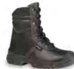
RANGER - S. 37