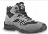
FLORIDA - S. 21