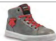
PREDATOR - S. 13